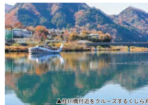
▲桂川橋付近をクルーズするくじら丸

令和7年11月30日（日）、「桂川（相模川）渓谷絶景クルーズ」が行われました。上野原市観光協会主催、相模湖および藤野観光協会共催で行われたこのクルージングは、相模湖のシンボルとも言うべき歴史ある遊覧船「くじら丸」に乗って、神奈川県立相模湖公園から上野原市島田地区の桂川橋付近までを往復するというもの。参加者は、往復2時間のクルージングで桂川および相模川渓谷の大自然を存分に堪能しました。