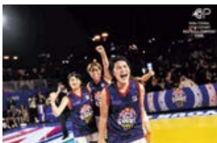
盛大な歓声の中、世界を獲るため出陣

第1戦 vs アゼルバイジャン、第2戦 vs ノルウェー、第3戦 vs 南アフリカ、第4戦 vs フィリピン、第5戦 vs アメリカ、決勝戦 vs エジプトと世界の強豪たちすべてに勝利し、世界一の栄冠を手に入れました。