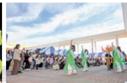
恒例のじょいそーらんによるパフォーマンス