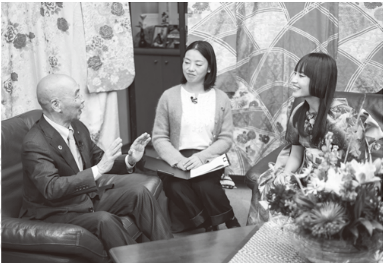
「私の好きなうえのはら」を語り合う場面では、お互い語りたいたことがたくさんあるようで、いつまでも話が尽きませんでした。

思っています。例えば、ご近所に独居のお年寄りが住んでいると、「たまにはご飯食べに来ない？」と家に招いて、1人にさせておかなかったり、もっとすごいなと思って感動したのは、ジャガイモを何列も作っていて、「この一列はそのおばあちゃんのため」と決めて作ってあげるんですよ。そういうのもすごいなと思います。 自然のことに気づけると、ある暮れの寒い日に、あたり一面に霧がかかっていて、高いところからそれを見ると、仲間川、鶴川、桂川、相模湖の方まで、龍のような流れで霧がかかっていて、あれは圧巻でした。ぜひ皆さんに見てもらいたいです。