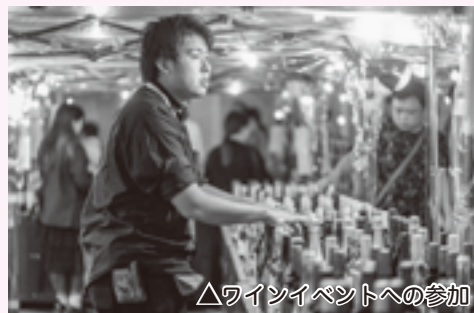
△ワインイベントへの参加

あけましておめでとうございます。 令和5年6月に上野原市へ移住して から約2年半が経ちました。同年10 月には地域おこし協力隊となり、地域 の魅力づくりに取り組み、多くの人に 上野原市を知っていただくため、都内 のワインイベントに参加するなど、市 の魅力発信に力を入れてきました。