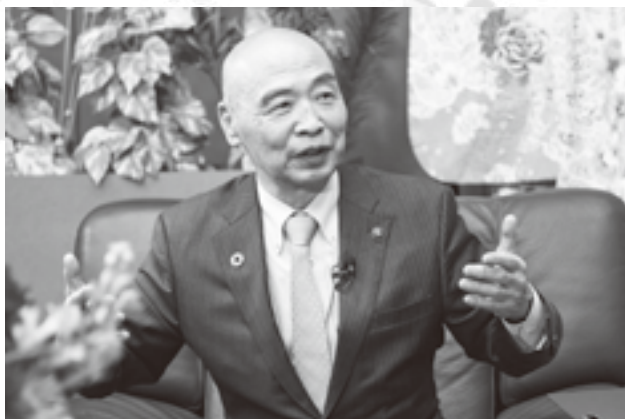
上野原市の良いところは、人の思いやりの心だと話す市長

ゆう理さん たしかにそうですね。あとと私、上野原の夜景が好きです。 この間、秋山温泉に行った帰りに、桂川のちよつと手前の山から降りてきたところ（新天神トンネルを抜けてメイルポイントゴルフクラブ入口交差点をさらに下った先）で駅の方を見ると、桂川のおかげで街が浮いているように見えてすごく綺麗で、多分皆さんいつも見ているものだと思うんですけど、私にとっては「心のパワースポット」なんです。 市長 「心のパワースポット」すごく良いですね。上野原市内には、パワースポットと言われている場所がたくさんありますからね。