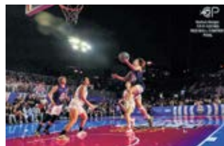
決勝のエジプト戦は接戦の末9-7で勝利