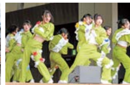
日大明誠高校ダンス部によるパフォーマンス