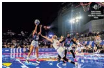
2日目に行われたアメリカ戦は10-6で勝利