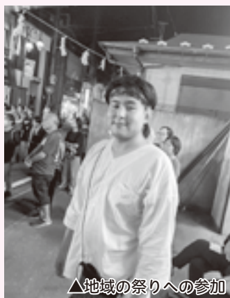
△地域の祭りへの参加

また、地域の特色を深く理解するた め、せいだ芋栽培のお手伝いや地元の 祭りへの参加、上野原青年会議所への 入会、消防団への入団など、地域と関 わる機会を大切に活動してきました。