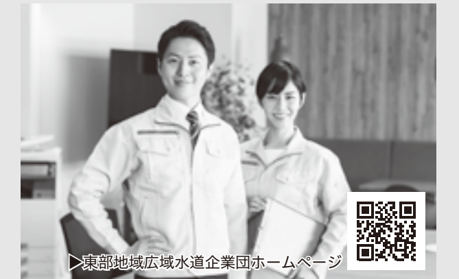
東部地域広域水道企業団ホームページ

〒409-0622 大月市七保町下和田415番地 東部地域広域水道企業団 総務営業担当 午前8時30分～午後5時（土日を除く）