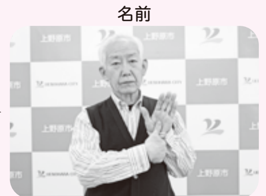
立てて前に向けた左手掌に右手親指をあてる。