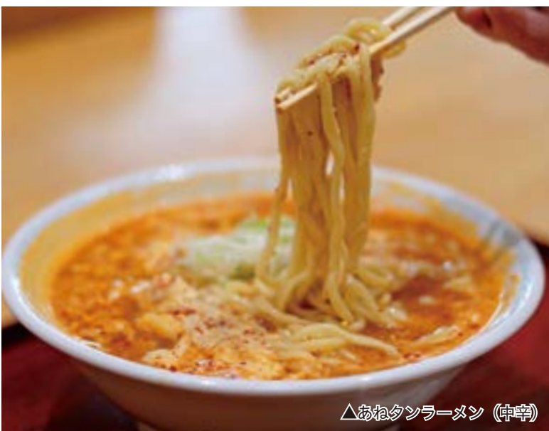
△あねタンラーメン（中辛）