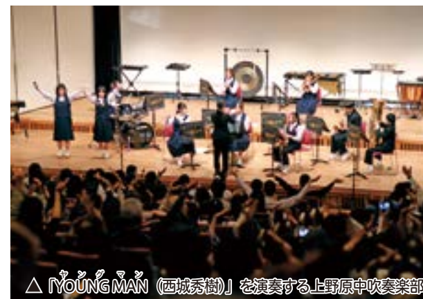
△「YOUNG MAN (西城秀樹)」を演奏する上野原中吹奏楽部

11月2日(土)～4日(月・振休)、もみじホールで市民による文化の祭典である「第47回市民文化祭」が開催されました。祭典では、合唱や箏曲などの舞台発表のほか、もみじホール内の各部屋で写真や書、絵画などの作品が展示されました。また、11月3日(日・祝)には、「第9回吹奏楽フェスティバル」が開催され、市内中学・高校・大学の吹奏楽部のほか、消防音楽隊、市民楽団などによる演奏が行われました。