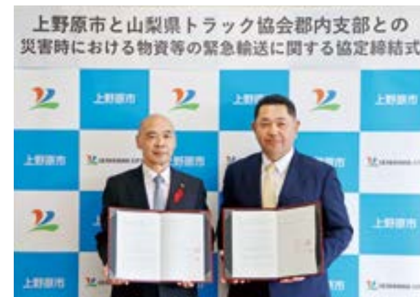
上野原市と山梨県トラック協会郡内支部との災害時における物資等の緊急輸送に関する協定締結式

11月6日(水)、山梨県トラック協会郡内支部と「災害時における物資等の緊急輸送に関する協定」を締結しました。この協定は、地震などによる大規模災害が発生したときに、市の地域防災計画に基づいて行う災害応急対策としての物資などの緊急輸送業務を山梨県トラック協会郡内支部にご協力いただけるといった内容で、大規模災害時の応急対策や被災者の生活支援などの迅速化が期待されます。