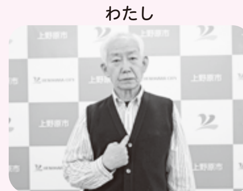
右手人差し指で胸を指す。