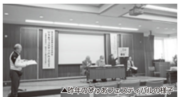
△昨年のぴゅあフェスティバルの様子 【問い合わせ】市男女共同参画推進委員会(総務課総務担当内) ☎62-3117

【2日目】12月15日(日) 午前10時開会 ●会場 ぴゅあ総合(甲府市朝気1-2-2) ●内容 ステージ発表、飲食物の販売、バザー、体験コーナーなど ※上野原市男女共同参画推進委員会も、寸劇「盛年の主張」でステージ発表に参加します。ぜひお越しください(午前11時30頃予定)。