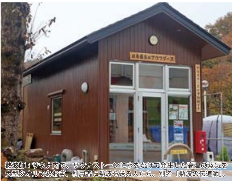
熱波師：サウナ内で、サウナストーンに水をかけて発生した高温の蒸気を大型タオルでおおぎ、利用者に熱波を送る人たち。別名「熱波の伝道師」。

また、熱波師の全国一を競う大会「熱波甲子園」で優勝経験もある「チーム熱風神」によるアウフグースを、毎週木曜日から日曜日の1日3回、屋外サウナで開催しており、究極のとのいを体験できます。