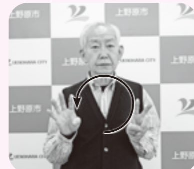
右手の数詞「4」と左手の数詞「2」を並べ、両手で垂直に円を描く。

●手話言語の国際デー9月23日(月・振休)に、もみじホール展望室をブルーにライトアップします。