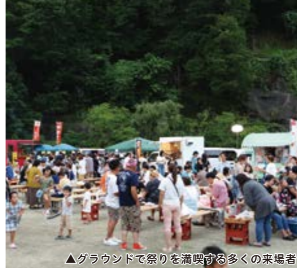
▲グラウンドで祭りを満喫する多くの来場者