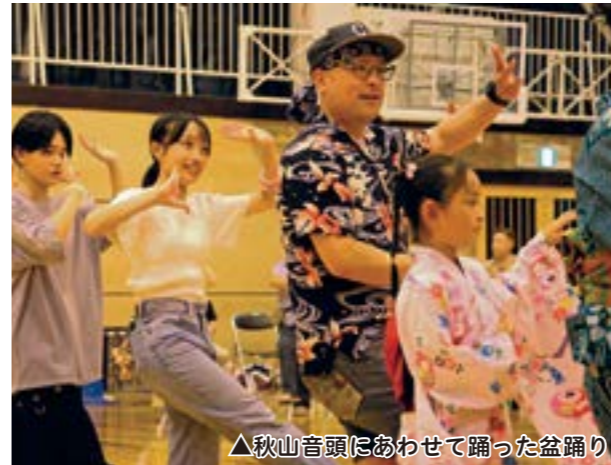
▲秋山音頭にあわせて踊った盆踊り