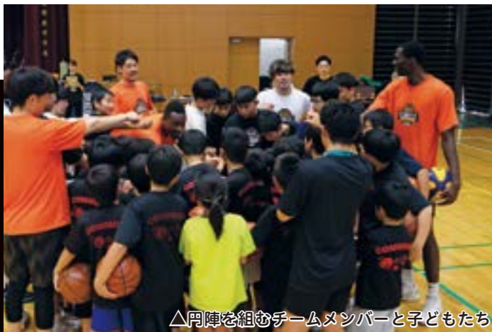
▲円陣を組むチームメンバーと子どもたち

秋山地区の夏を象徴する一大イベントであるこの祭りは、秋山青年会が中心となって毎年この時期に開催されています。しかし、令和元年に開催以来、昨今の新型コロナウイルス感染症の影響により中止を余儀なくされ、今回、実に5年ぶりの開催となりました。中学校のグラウンドは、キッチンカーを中心にフードの出店が立ち並び、食の会場となり、多種多様なグルメが来場者を楽しませました。