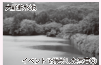
イベントで撮影した写真⑧

このコーナーでは、市立病院のみなさんの思いをお伝えしていきます。当面、隔月掲載の予定です。