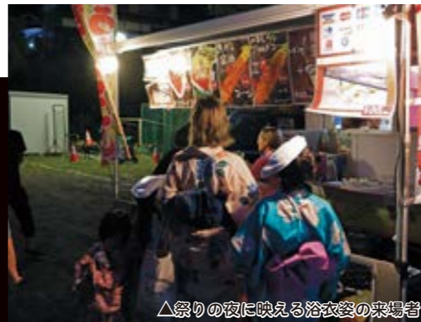
▲祭りの夜に映える浴衣姿の来場者