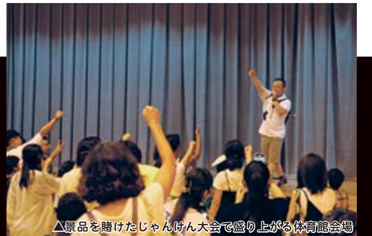
▲景品を賭けたじゃんけん大会で盛り上がる体育館会場