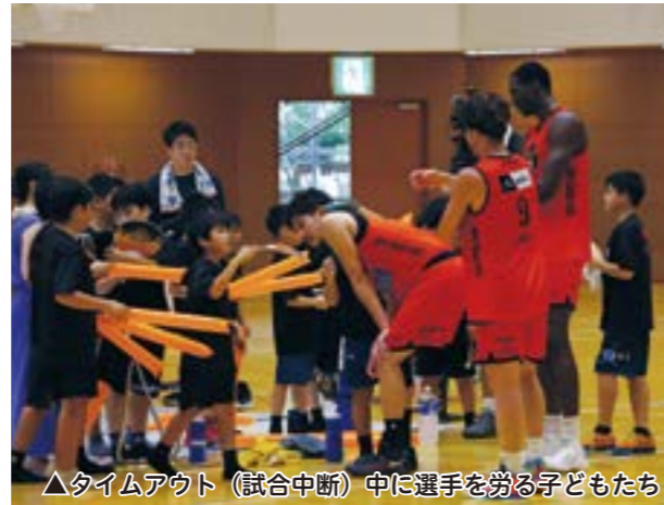
▲タイムアウト（試合中断）中に選手を労る子どもたち