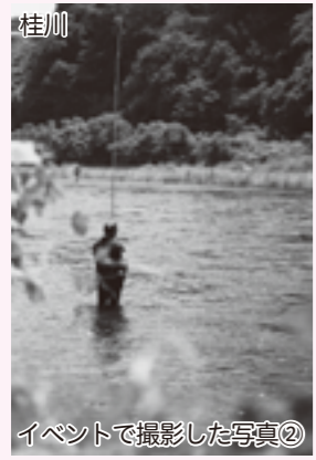
イベントで撮影した写真⑨

を受け、シャッターを切る楽しさを共有しました。次回の開催は、10月20日(日)午後2時～5時で、秋の始まりの上野原の風景を堪能する予定です。また、上野原駅北口前の見晴亭では、月に一回の「マナビバ」やその他さまざまなイベントを開催しています(9月は「御春山ネイチャーウォーク」と「森林浴体験」を開催予定)。詳細については、見晴亭のInstagramもしくは施設前のポスターやチラシなどをご覧ください。