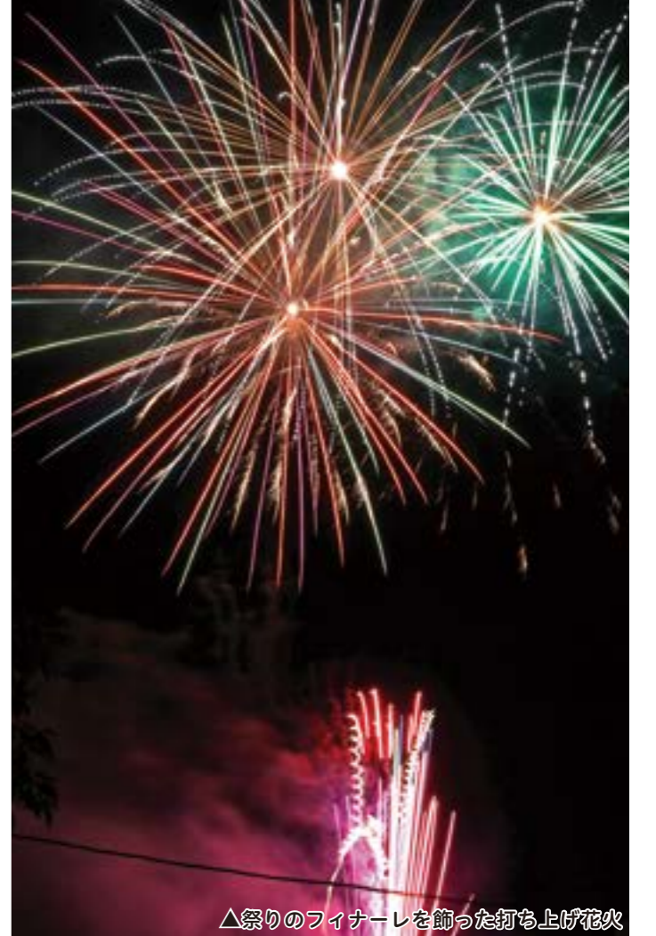
▲祭りのフィナーレを飾った打ち上げ花火