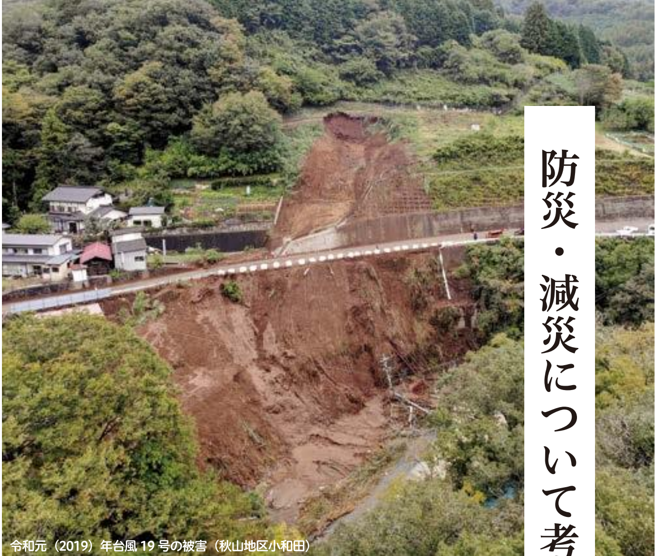
令和元（2019）年台風 19 号の被害（秋山地区小和田）