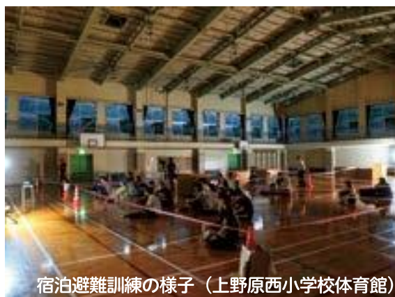
宿泊避難訓練の様子（上野原西小学校体育館）