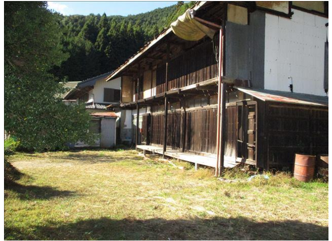
外観 駐車スペース