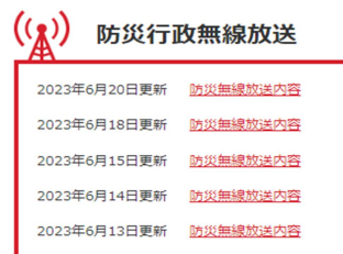
ホームページ掲載イメージ