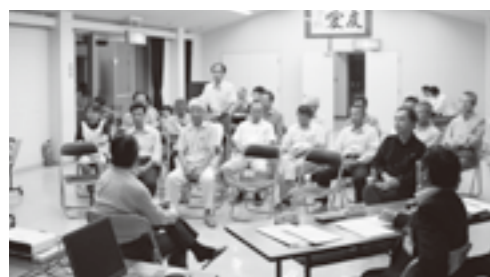
西原地区の開催の様子

5月30日(土)、西原出張所3階多目的ホールで、『よっちゃん市民座談会 in 西原』を開催しました。当日は、23名の地域のみなさんが参加し、市の将来について話し合いました。参加者からは、『移住促進を図るには、空き家の持ち主と借り主をつなげるコーディネーターが必要』『旧西原小学校や教員住宅などを大学などに貸して、地域と学生との交流を図り、地域活性化につなげたらどうか』など、多くの提案がありました。