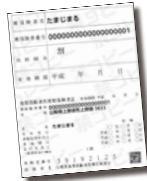
▲8月1日以降からさくら色になる後期高齢者医療被保険者証（見本）

限度額適用・標準負担額減額認定証 後期高齢者医療被保険者証と同じく 8月1日から新しい認定証となります。 ※前年度交付を受けている方で、引き続き適用要件に該当する方については、山梨県後期高齢者医療広域連合から認定証が交付されます。