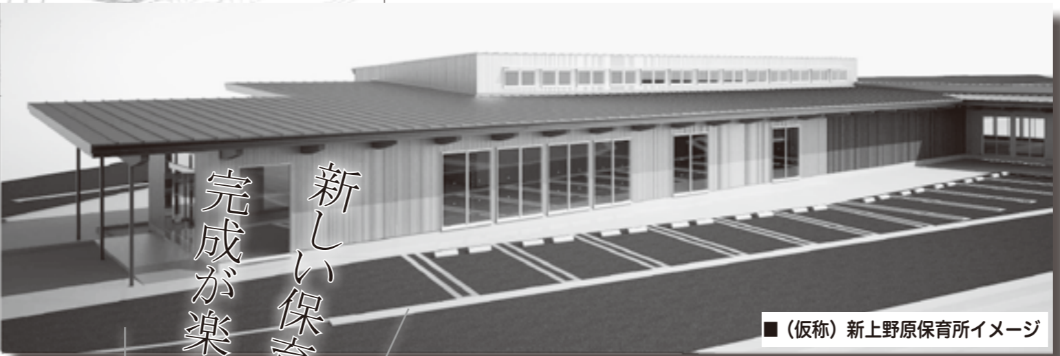
■(仮称)新上野原保育所イメージ

市では、旧市立病院跡地に、平成27年6月議会により承認された(仮称)新上野原保育所の建設を進めています。 これは、市の将来を担う子どもたちの健やかな発達を願うこと、快適な保育環境を提供すること、また、その保護者を全面的に支援することなどを目的としているものです。 そこで、(仮称)新上野原保育所の建設に向けての経緯や今後の予定などをお知らせします。