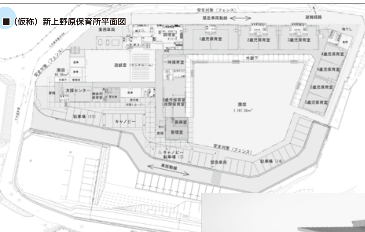
■(仮称)新上野原保育所平面図