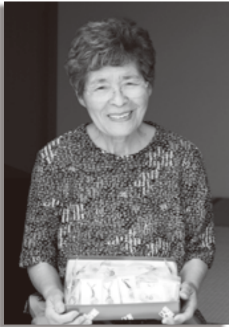
市内で頑張っている方、輝いている方が身近にいましたら企画課まで紹介してください。企画課政策推進担当 ☎62-3118