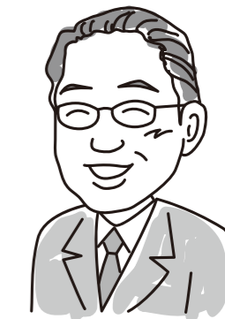
上野原市長 江口英雄