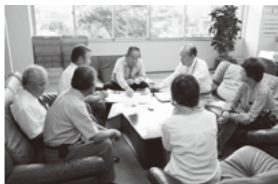
▲過去の市民のみなさんと市長とのふれ愛トークの様子

●方法 1人または1組（5人程度）を対象として、対話時間はおおむね20分間です。 ●場所 市長室 ●申込み・問い合わせ 企画課政策推進担当（☎621-3118 FAX 621-5033） ●メールアドレス kakaku@city.uenohara.lg.jp