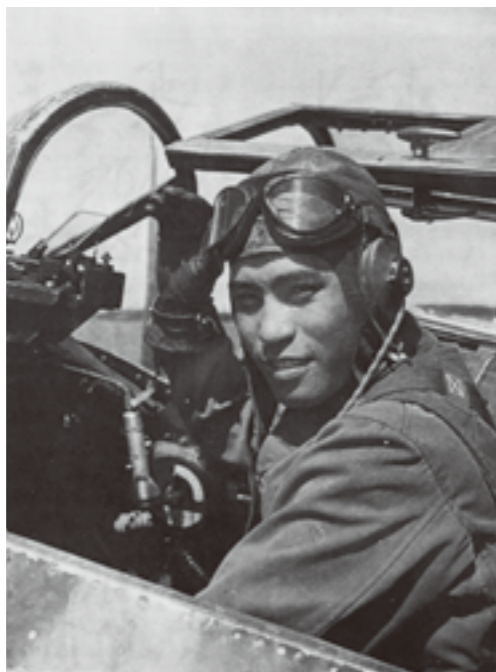
とりにゅう ひろせはる 屠龍で B29 に体当たりした廣瀬治陸軍大尉