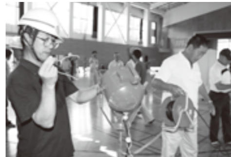
昨年度の避難所設置運営訓練の様子