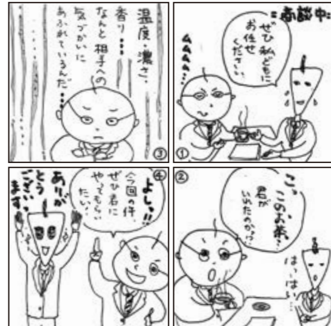
作：上野原市男女共同参画推進委員会 画：石井京子