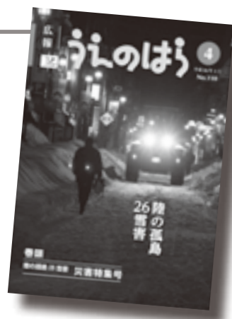
▲災害特集号の表紙(仮)

発行については、特集内容や発行方法、また、被害状況や行政情報がまとまり次第、発行します。