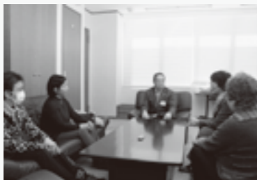
ふれ愛トークの様子