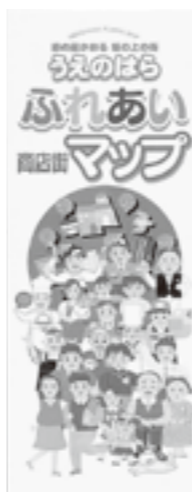
▲市商工会が発行するパンフレット

市商工会は、昨年度から市内の飲食店や菓子類製造販売店を紹介するパンフレットを作成しています。このパンフレットには、各店舗のメニューや写真などが掲載されていて、魅力あるパンフレットになっています。今後は、このようなパンフレットなどの情報を市のホームページで紹介できるように取り組んでいきますので、ご理解をお願いします。なお、市のホームページには、市商工会のホームページにリンクしています。このなかで、目的別事業所検索をご覧いただくと店舗紹介が掲載されていますので、参考にしてください。