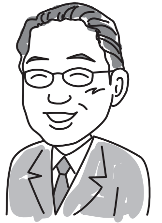
上野原市長 江口英雄