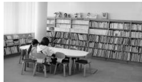
もっと、市立図書館の書籍を活用しましょう。

『平手造酒』 懐かしの日本映画名作 ◎日時 4月29日（日） 午後2時～3時5分