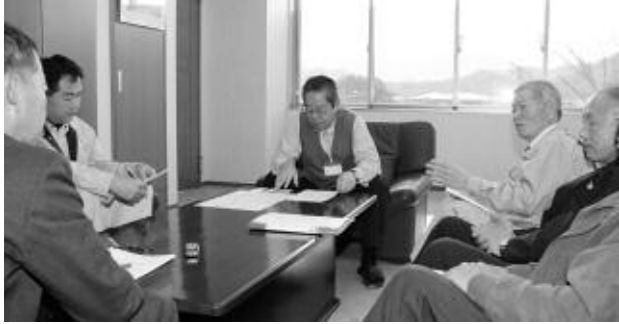
過去に行われた市民のみなさんと市長とのふれ愛トーク開催の様子

「市民のみなさんと市長とのふれ愛トーク」は、市長が市民のみなさんから地域の身近な課題や提言等を直接お伺いし、お答えするものです。