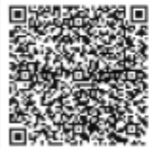
消防メールマガジンQRコード

なお、4月号の広報でお知らせした消防メールマガジンのQRコードは、読み取ることができない場合があります。再度、次のQRコードから読み取りください。