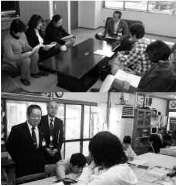
(写真上) 3月27日に開催された市民のみなさんと市長とのふれ愛トークの様子、(写真下) 上野原福祉作業所を視察する江口市長

「市民のみなさんと市長とのふれ愛トーク」は、市長が市民のみなさんから地域の身近な課題や提言等を直接お伺いし、お答えするものです。