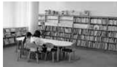
もっと、市立図書館の書籍を活用しよう。

◆一般書 『桜舞う』 あさのあつこ／著 PHP 研究所 「お願い、助けて・・・」 散りゆく桜の下で、亡くな ったはずの友がささやい た。江戸の菖蒲長屋を舞台 に描く青春時代ミステリ 。