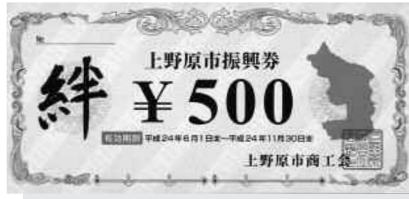
◆「上野原市振興券 絆」見本