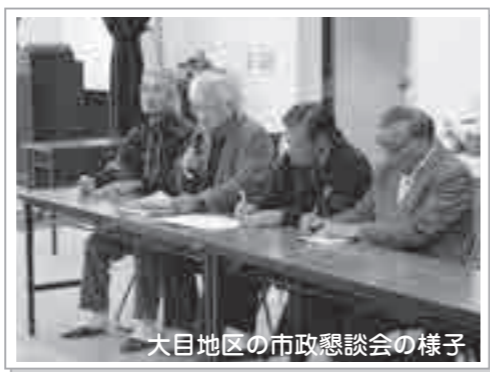
大目地区の市政懇談会の様子

質問 大目地区における地域活性化と旧大目小学校耐震対策について聞きます。 大目小学校統廃合や大目保育園の休園による跡地を見ると、見るに見かねる状況です。校舎を有効活用したらどうかという意見もあり、市にお願いしています。耐震が問題で利用できないとのことですが、今後校舎や跡地をどのように活用していくか方向性が見えない状況です。 そこで提案ですが、耐震の問題があるのであれば早急に校舎を取り壊していただき、その跡地に防災公園を作ったらいかがでしょうか。そこには、1000トン貯水できる水槽を作り、飲料水の確保を行ったり、下水層の設置も行う。有事の際は、テントなどが設置できるように芝生を植えたり