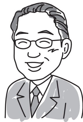
上野原市長 江口英雄