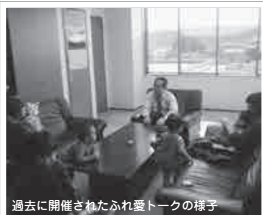
過去に開催されたふれ愛トークの様子

これまでに開催された「市民のみなさんと市長とのふれ愛トーク」では、多くのご意見やご提言をいただいています。