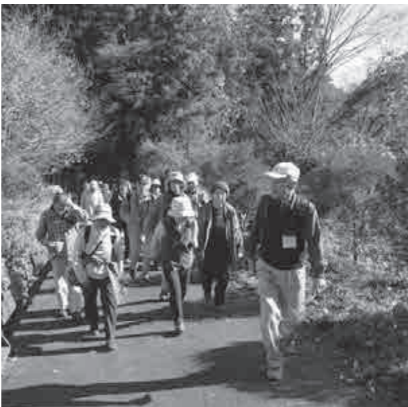
昨年、桐原地区で行われたフットパスの様子

上野原市国民文化祭実行委員会では、第28回国民文化祭・やまなし2013フットパスイベントを開催します。