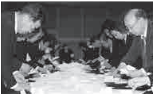
上野原市長選挙の開票の様子