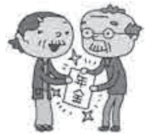
平成25年度 国民年金保険料 納入額早見表（現金納付・口座振替比較）

金融機関等の窓口を用意してある「国民年金保険料口座振替納付申出書」に必要事項を記入し、金融機関等の届出印を押印のうえ、お申込みください。申出書は市役所市民課国保年金担当にも用意してあります。 ※4月から口座振替での1年前納・