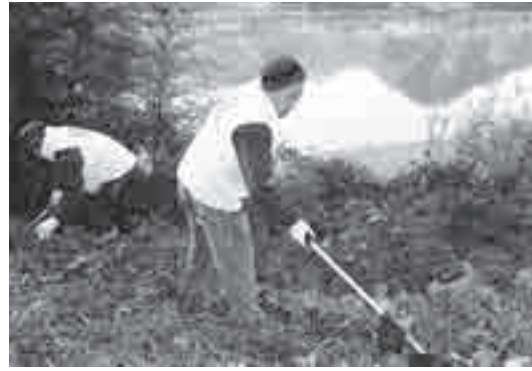
※市内ボランティアグループ「上野原をきれいにしようの会（UKK）」の清掃活動の様子

私たちの生活環境を良好に保ち、不法投棄から地域を守るには、「自分には関係ない」と知らない顔をするのではなく、地域の問題としてみんなで取り組み、不法投棄されない環境をつくるのが最も大切です。市では、これまでも県や上野原建設業協会と協力し、市内の不法投棄パトロールを実施するほか、地域ボランティアによる清掃活動の支