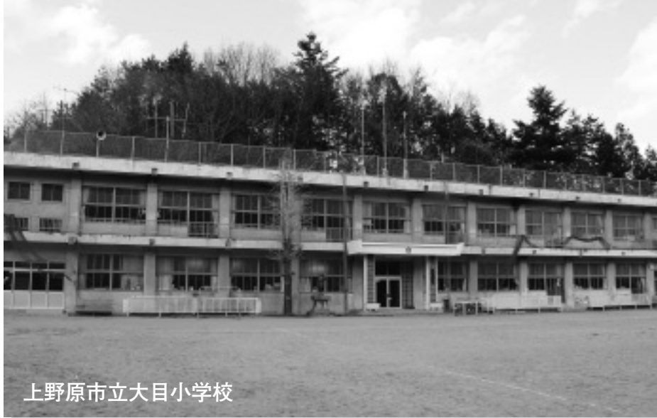
上野原市立大目小学校