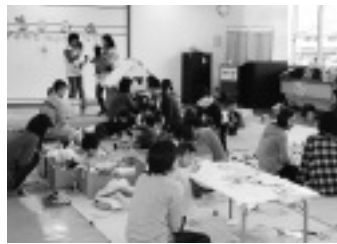
▲子育てプレイルームの様子

※プレイルーム内において「おもちゃ病院(午前11時～正午)」開設していただきますのでご利用ください。