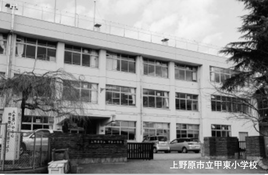
上野原市立甲東小学校