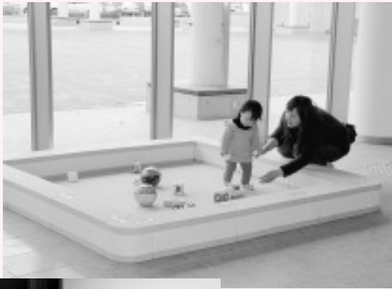
◀福祉課カウンター前の子供用遊び場

市では、子連れのお客さんが、福祉課カウンターで手続きをしている間、子どもが遊んでいられるよう遊び場を作りました。また、授乳室2か所におむつを交換する台を設置しました。