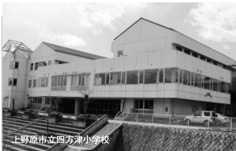
上野原市立四方津小学校

明治6年12月 旧巖福昌寺を仮校舎と して開校する。 大正9年10月 旧四方津小木造校舎を 竣工する。 昭和30年4月 町村合併により上野原 町立四方津小学校となる。 平成3年10月 新校舎起工式を挙行す る。 平成5年4月 新校舎を開校する。 平成9年3月 増築校舎が完成する。 平成12年5月 学校給食を開始する。 平成23年3月 上野原市立四方津小学 校閉校式を挙行し、閉校と なる。