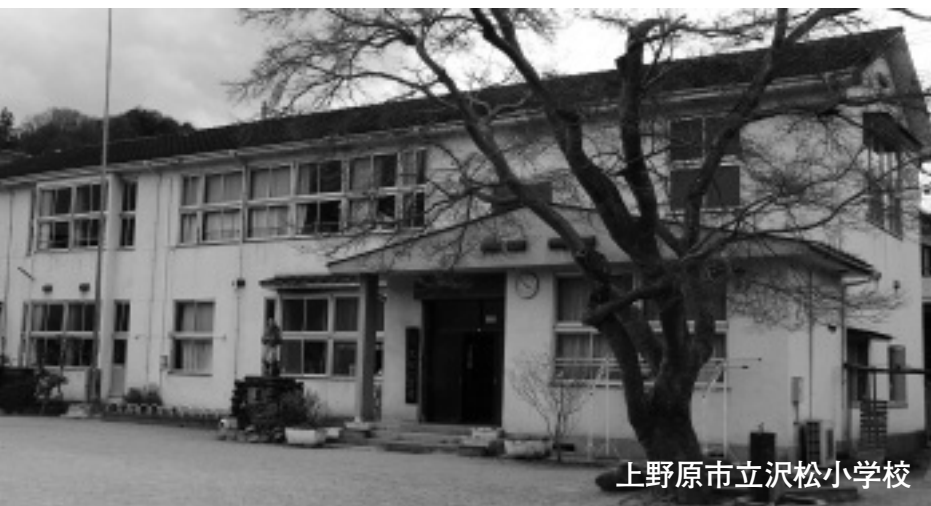
上野原市立沢松小学校