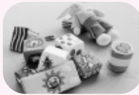
▲遊び場には、人形なども用意してあります。