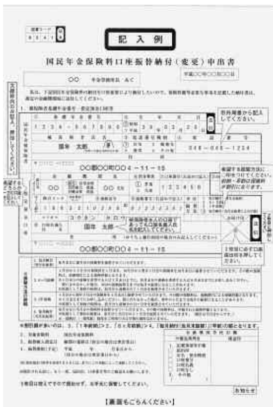
▲ 国民年金保険料口座振替納付申出書の表面に記入例がありますので、記入例を参考に必要事項を記入のうえ、金融機関等へ提出してください。

手続きは、金融機関等の窓口へ備え付けの「国民年金保険料口座振替納付申出書」に必要事項を記入し、金融機関等届出印を押印のうえ、提出してください。申出書は、市役所市民課国民年金担当にも用意してありますのでご利用ください。