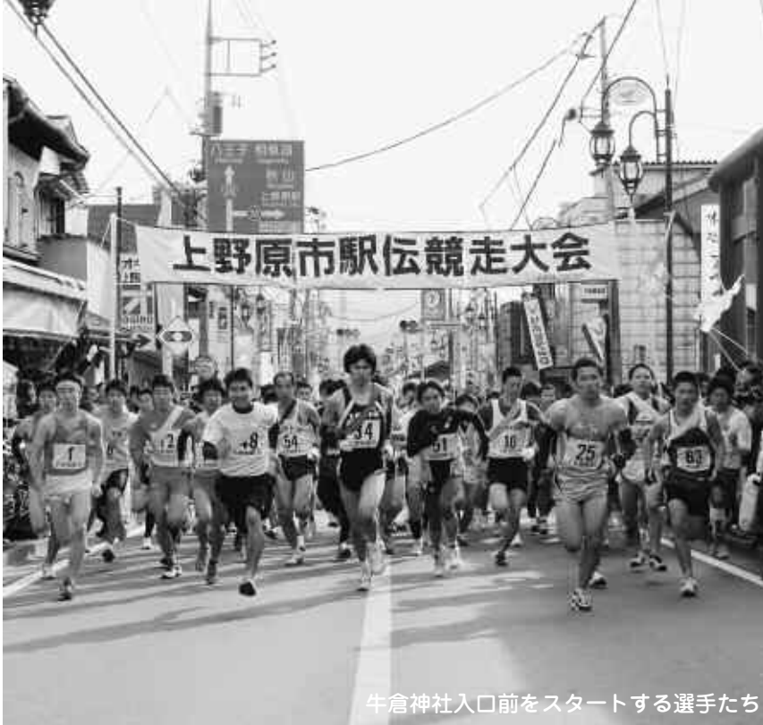
牛倉神社入口前をスタートする選手たち

ゴールするなど健闘が光りました。市内小学男子の部では、リヴィエールFCブルー(6年)がリヴィエールFCピンク(6年)と競り合い、僅差で優勝。市内小学女子の部では、混戦のなか甲東体育会が優勝を果たしました。その他の主な結果は次のとおりです。