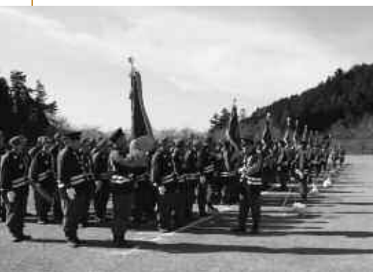
▲出初式に参加する市内の各消防団

巖分団四方津地区(有)網野自動車科クリニック ●問い合わせ 消防本部庶務担当(☎62-4111)