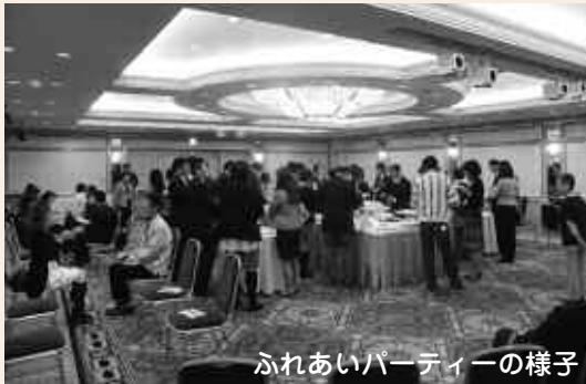
ふれあいパーティーの様子

※抽選の場合は、当選者の方に案内通知を発送します。(案内通知は、2月24日(金)に発送します)