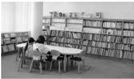
もっと、市立図書館の書籍を活用しましょう。

●声の広報 市立図書館には、目の不自由な方のために広報うえのはらの内容を録音したテープ（声の広報）を置いています。 声の広報は、上野原朗読の会のご協力により録音されています。