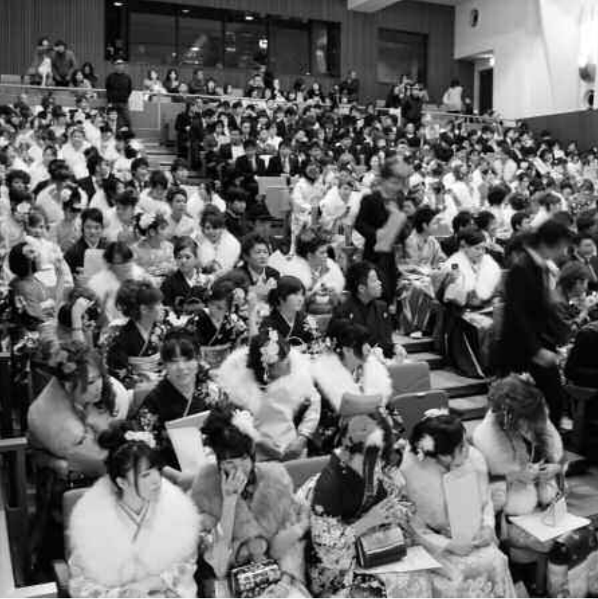
▲もみじホールには、座席が満席になるほど多くの新成人が集まりました。また、会場には、新成人の保護者のみなさんも集まり、立派に成人した子どもたちの晴の姿を見て、万感の思いで祝福していました。

当日は、9時30分頃から新成人が集まりだし、久しぶりに会う友人と肩を抱き合ったり、近況を話したり、写真を撮ったりと、10時30分の開式間際まで思い思いの時間を過ごしていました。