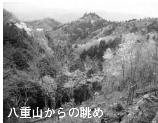
八重山からの眺め