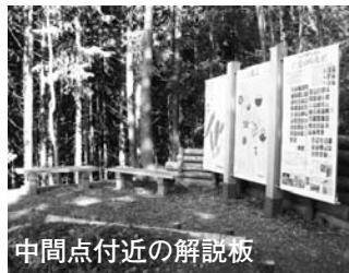
中間点付近の解説板