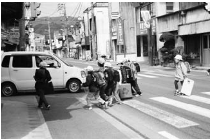
▲ドライバーは歩行者に配慮した運転を心掛けましょう。

ドライバーのみならず、子どもや高齢者を見かけたら、スピードを落としたり一時停止をするなどして、安全に通行できるように配慮してください。