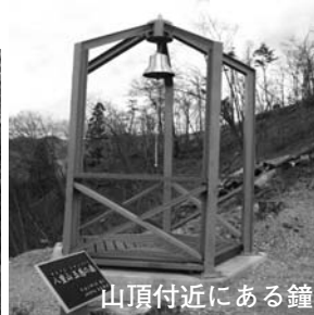
山頂付近にある鐘