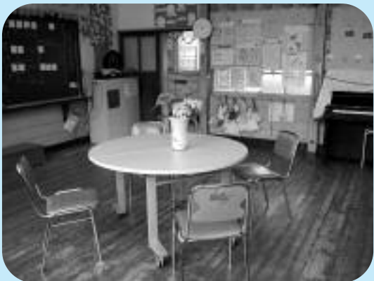
▲沢松小学校校舎内

●日時 8月13日(金)～15日(日) 午前9時～12時、午後1時～4時 ※当日、職員室で受付します。