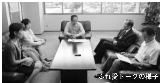
ふれ愛トークの様子

企画課政策推進担当(☎02-33118621-5 3030) Email: kikaku@city.uenohara.lg.jp