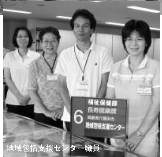
地域包括支援センター職員