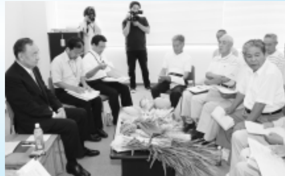
▲上野原市新鮮野菜生産者の会と県知事 (市役所防災会議室)