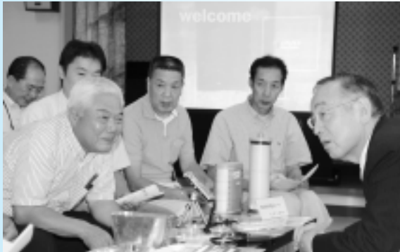
▲上野原機械器具工業協同組合と県知事 (商工会会議室)

8月25日、市役所防災会議室と商工会会議室で、「県政ひざづめ談義」が行われました。これは、山梨県が企画した事業で、横内正明県知事と県内の各種団体とが膝をつめる距離で、それぞれの地域の身近な話題や、県や市の政策に関することなどについて意見交換をするもので、今回は、市内の上野原市新鮮野菜生産者の会と上野原機械器具工業協同組合の2団体が、県知事と活発な意見交換を行いました。