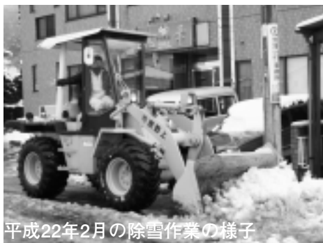
平成22年2月の除雪作業の様子

たいと考えています。ご協力いただける場合は、建設課までご連絡ください。●問い合わせ 建設課道路河川担当（☎62-3123）