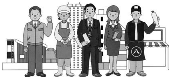
調査員がお伺いする場合は、必ず「調査員証」を携行しています。