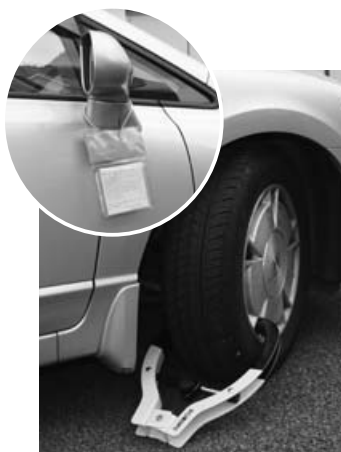
▲タイヤロックによる 運行禁止措置例