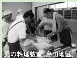
男の料理教室(島田地区)

現在の第2期の推進委員は9月で任期が終了します(2年任期)。第2期の推進委員会では、島田地区で「男の料理教室」を公民館と共同して企画運営しました。また桐原地区で、