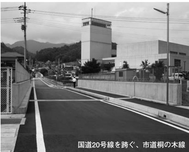
国道20号線を跨ぐ、市道桐の木線