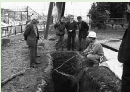
▲柵の内外で地下の根系調査を行いました。写真は市文化財保護審議会の視察の様子です。

幹内側の保護シートを1年ぶりにはがすと、若い不定根(ふていこん)がぎっしり生えていました▼