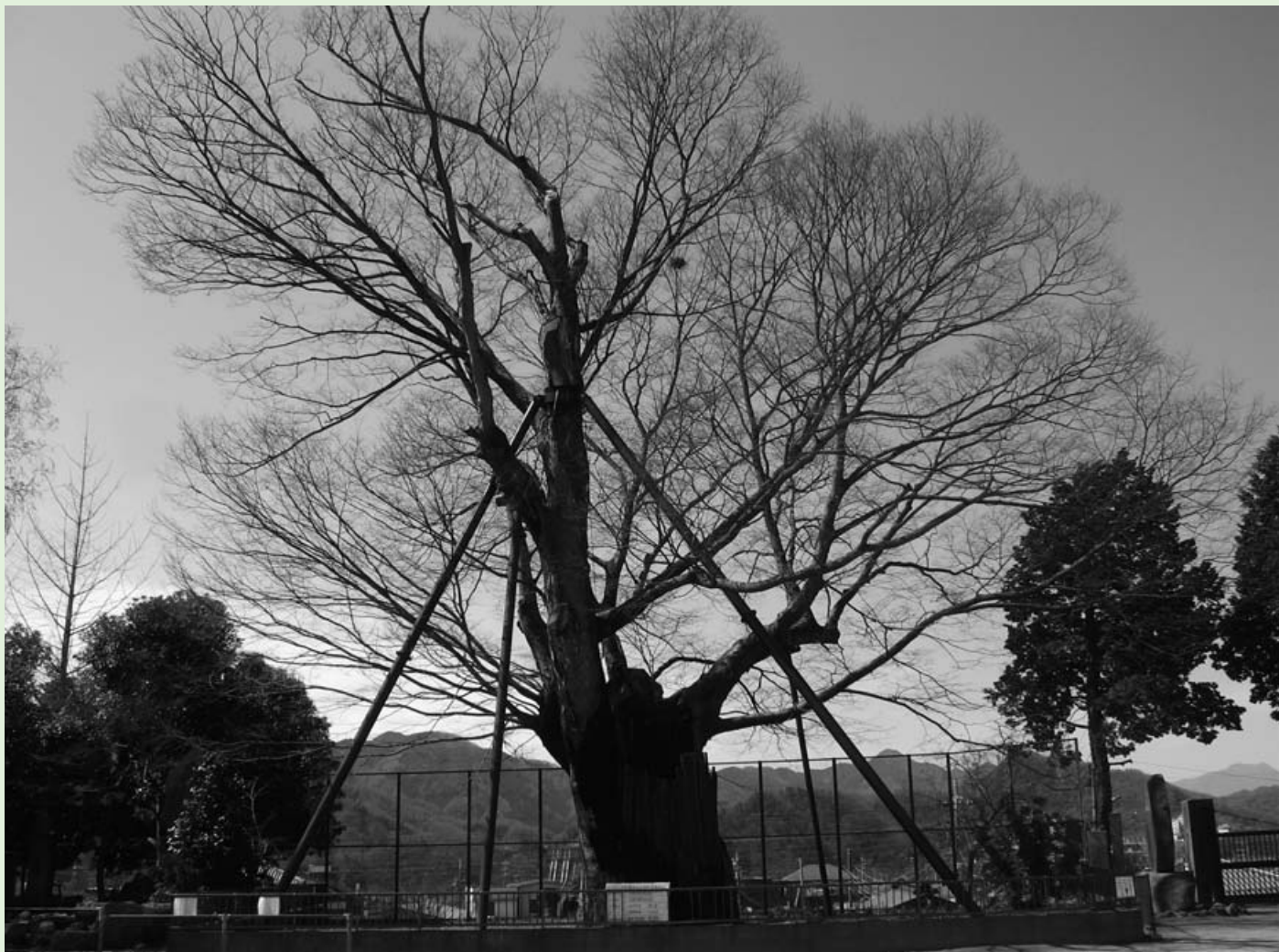
▲上野原の大ケヤキ。支柱を3本増やし、大枝の一部を切って重くなった樹冠(じゅかん)の負担を軽くしました。