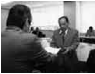
▲委嘱状交付式の様子