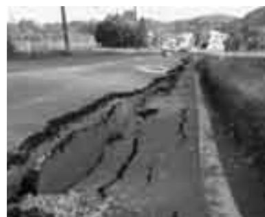
▲震災の爪あと(新潟県中越沖地震)