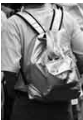
▲日ごろから非常用持出袋の準備を