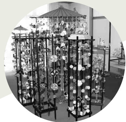
▲つるし雛の展示(秋山文化祭)

秋山文化協会主催の文化祭は今年で34回目の開催となりました。今年も作品の展示や舞台発表に多くの方の参加いただき、また地域の方々にも数来場していただき、とても感謝しています。 これからも多くの方にご協力いただき、また、多くの方に秋山文化協会に携わっていただく中で、芸術・文化の向上や地域の活性化につながるように活動し盛り上げていきたいと思えます。