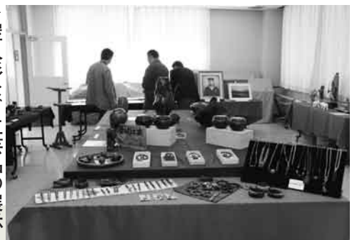
▼屋久杉など工芸品の展示 (秋山文化祭)