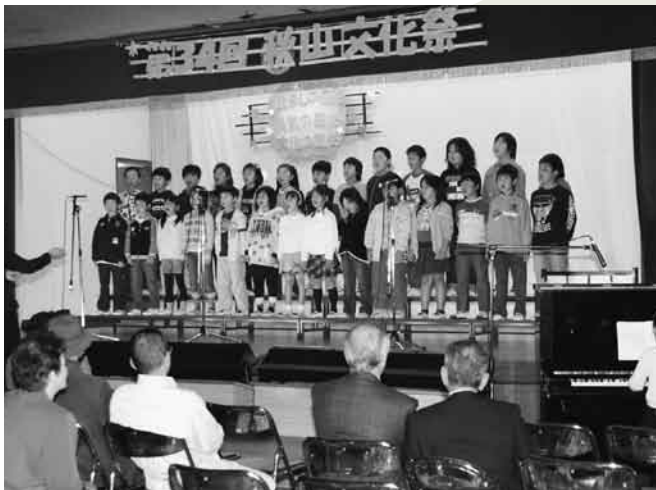
▼秋山小児童による合唱(秋山文化祭)