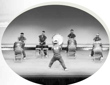
▲力強い演奏をする清流太鼓

上野原市文化協会では10月31日から11月3日までみじホールを会場に、秋山文化協会では11月3日、秋山老人福祉センターでそれぞれ文化祭を開催しました。 文化祭は、日ごろの芸術・文化活動の成果を多くの方に発表する機会であり、また芸術・文化に触れる機会でもあります。展示会場には、日ごろから丹精込めて制作した選りすぐりの作品が展示され、また舞台発表では吹奏楽の演奏や演舞などで来場者を魅了しました。 11月3日の文化の日を中心に行われた文化祭。多くのみなさんが芸術・文化に触れる良い機会となったのではないのでしょうか。ここでは、文化祭の様子をご紹介します。