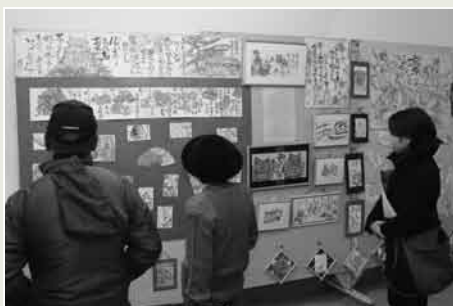
▲絵手紙作品の展示