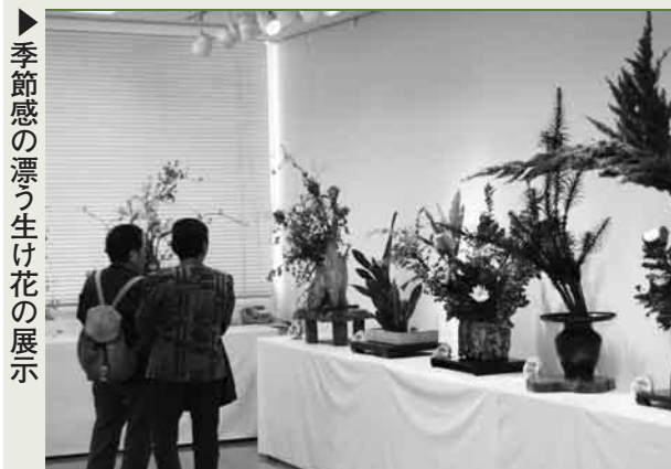
▶季節感の漂う生け花の展示