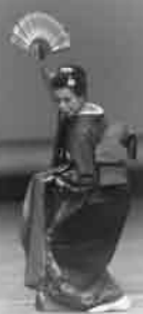
▲華麗な舞を披露する日本舞踊