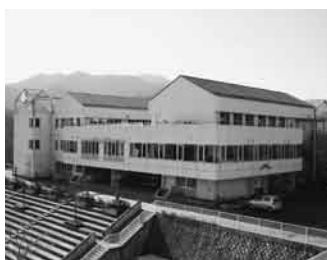
▲上野原西小学校として再編成される四方津小学校

◆お問い合わせ 学校適正配置推進課学校適正配置推進担当(☎62-3408) ◆なお、教育委員会方針の全文は、市ホームページ、教育委員会学校適正配置推進課、秋山支所および各出張所で閲覧することができます。