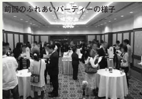
前回のふれあいパーティーの様子