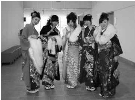
▲20歳の門出を記念写真に収める新成人