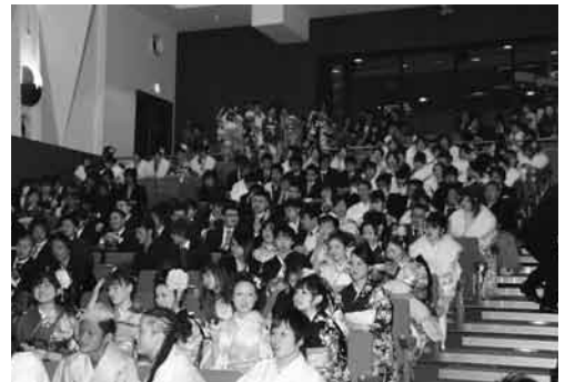
▲アトラクションで盛り上がる会場