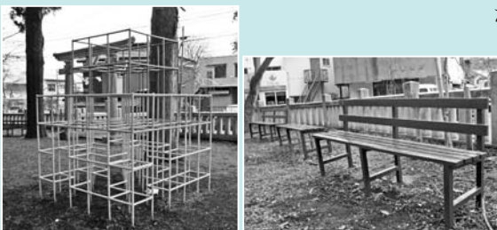
▲塗装が完了した牛倉神社境内の遊具やベンチ

牛倉神社の境内にある遊具やベンチの塗装について、このたび、新二地区が上野原地区社会福祉協議会からの補助金(子供遊園地補修事業)を元に、1月中旬に塗装を行いました。