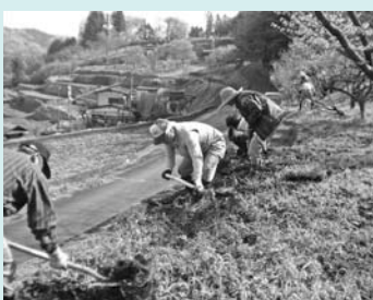
▲芝桜の植栽。地区の方が1つ1つ丁寧に植えました。