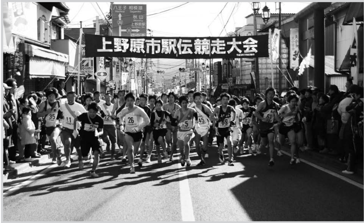
▲午前10時30分、国道20号線牛倉神社前を一齐にスタートする選手たち(一般・その他の部)