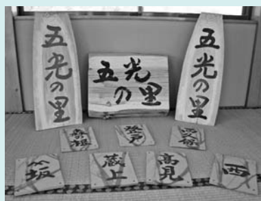
▲完成したサイン（写真上部）と屋号標（写真下部）

住みやすい地域づくりの一環として、富岡区各戸の屋号標と、富岡区の目印となるような丸太のサインを作成しました。