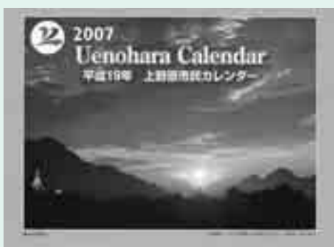
▲平成19年上野原市民カレンダー