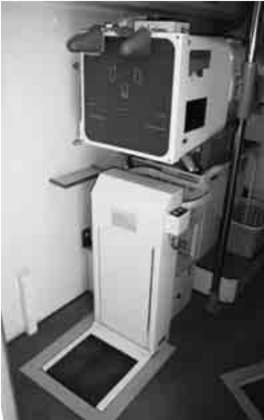
▲結核検診用X線装置