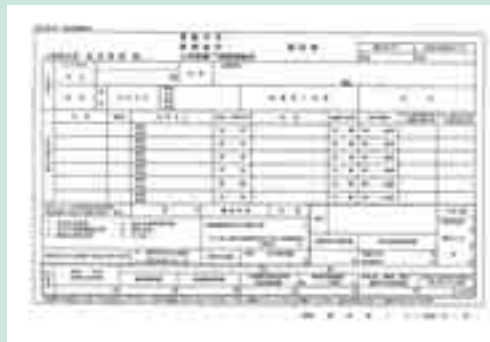
▲児童手当現況届の用紙

・厚生年金に加入している方は、「健康保険被保険者証の写し」または「年金加入証明書」を添付してください。 ※「現況届」の用紙は、現在手当を受給している家庭に、6月分の支払通知書と一緒に郵送しています。