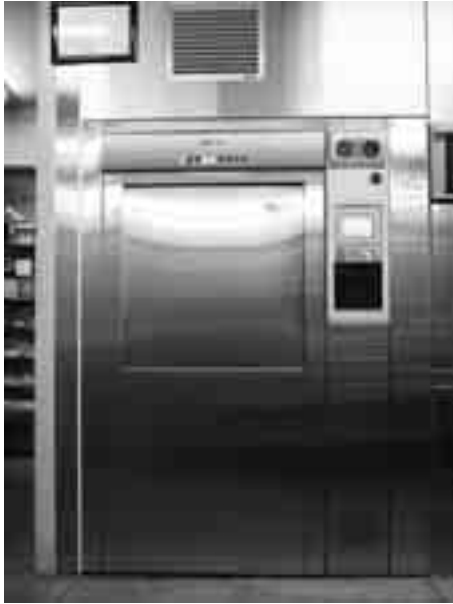
▲医療器具を滅菌する高圧蒸気滅菌装置

器械および備品整備事業として、高圧蒸気滅菌装置、食器洗浄機、ホルター心電図等を購入しました。