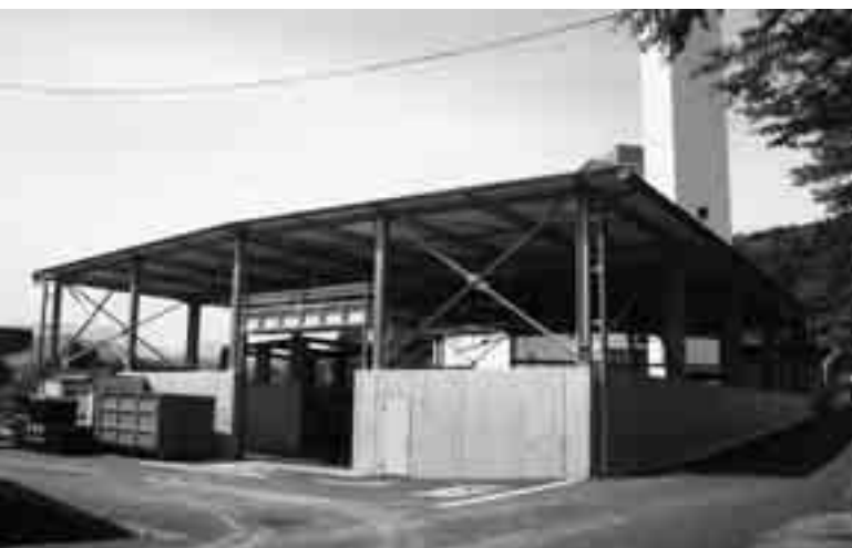
▲リサイクルの拠点施設として整備が進められている クリーンセンター内のリサイクルプラザ