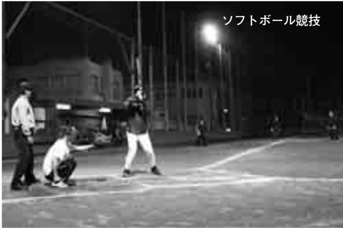
ソフトボール競技