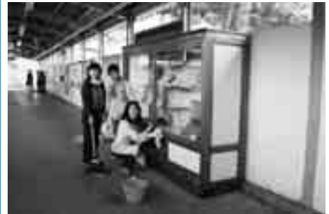
▲上野原駅の陳列棚の清掃

当日は、商工会青年部や女性部の方が参加して行われ、上野原駅の商工会の陳列棚や河川のゴミ拾いなどを行いました。