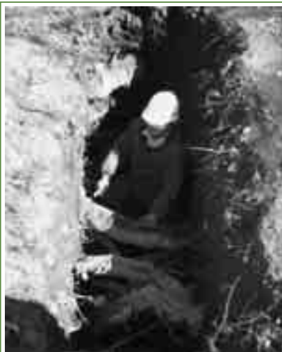
地下根調査の様子です。ケヤキは明治6年の学校造成時に5m程度埋められたと伝えられ、根の生育状況が心配されていました。調査の結果、大元の根は枯れているようですが、地中のケヤキ主幹から新たな根を多数伸ばし、ケヤキが生育環境の変化に応じて精一杯生きようとしていることが分かりました。