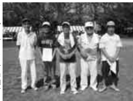
クイズウォーキング参加者

で大会を盛り上げました。結果はクイズウォーキング大会で3位に入賞するなどの健闘を見せました。