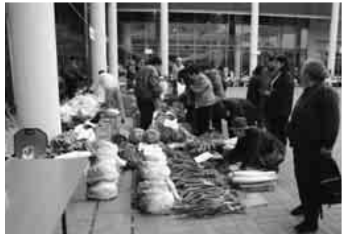
農林産物直売コーナー