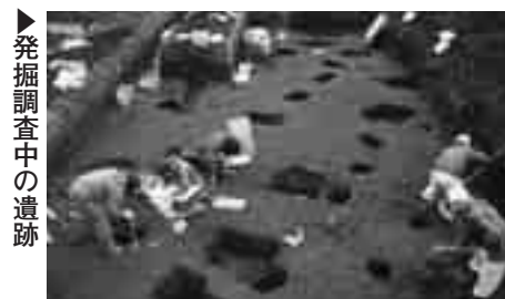
▶発掘調査中の遺跡