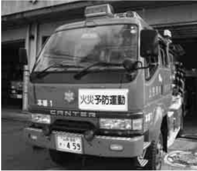
▲市民の安全を守る消防ポンプ自動車