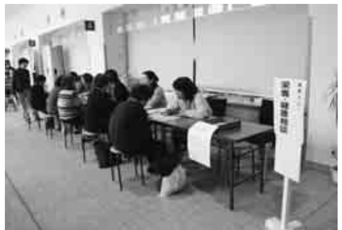
健康相談コーナー