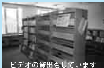
ビデオの貸出もしています

事務室の壁面にある予定表には、8つある部屋の利用団体のマグネットシートがびっしりと貼られていました。必要であれば