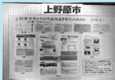
上野原市の取り組みの展示