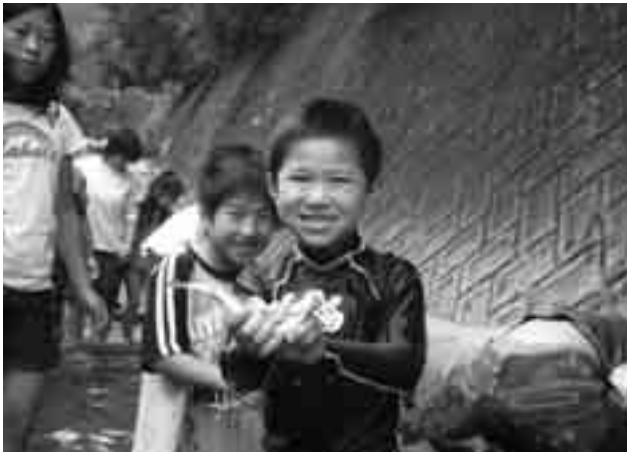
▶ 昨年の活動の様子