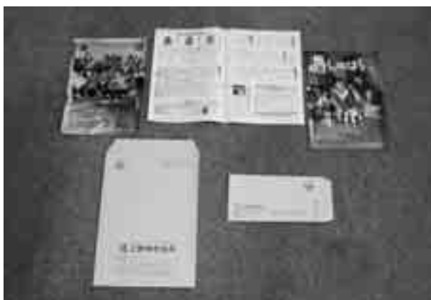
▶ 広告が掲載される広報うえのはらと上野原市封筒