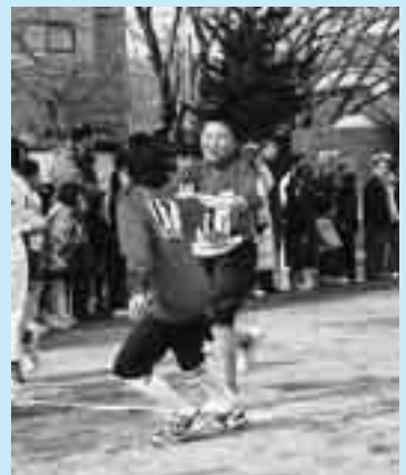
◀ 1区から2区へたすぎの中継