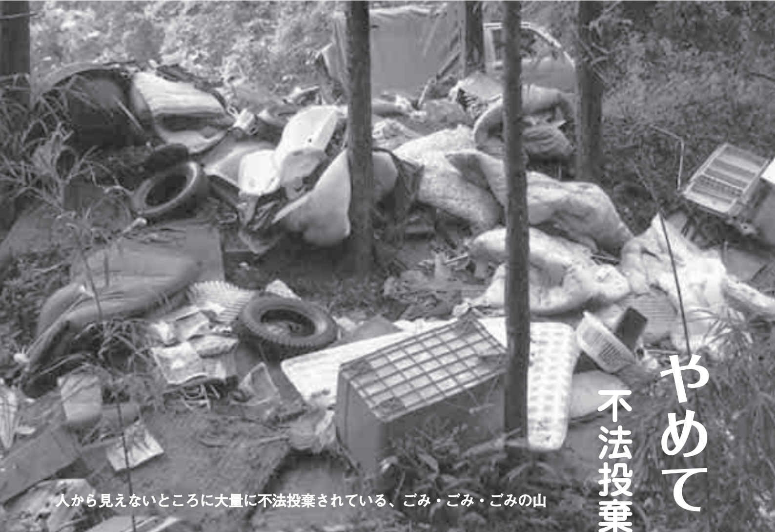
人から見えないところに大量に不法投棄されている、ごみ・ごみ・ごみの山