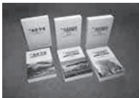
▲広報うえのはら・あきやま縮刷版

市では、旧町村のあゆみや出来事がぎつりつまった旧上野原町の広報うえのはらと旧秋山村の広報あきやまの縮刷版を作成し、販売しています。ご希望の方はお求めください。