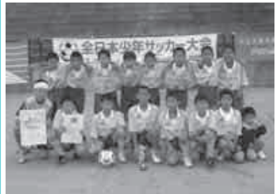
▲関東大会出場を喜ぶ選手たち