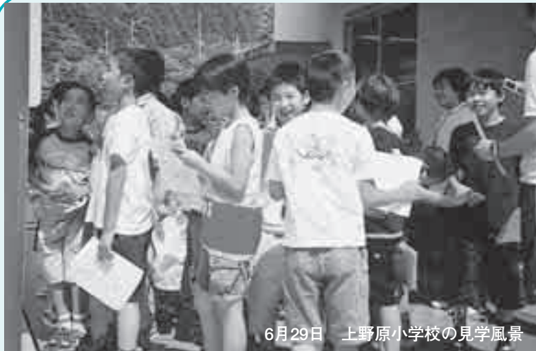
6月29日 上野原小学校の見学風景

毎年、市内の小学4年生によるクリーンセンターや消防署への社会科見学が実施されています。クリーンセンターへの見学は、子どものころか