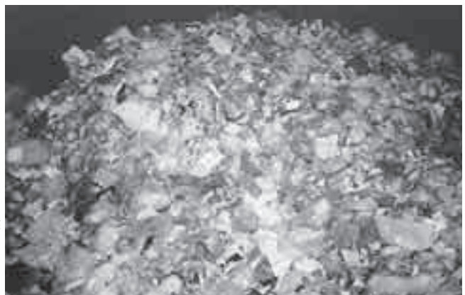
▶家庭から排出された可燃ごみ

いましょう。(余分に買ったものは、使わずに終わればごみになります。) ・捨てるべきのことを考えましょう。(テレビ・エアコン・冷蔵庫・洗濯機・パソコン等はクリーンセンターでは引き取りません。販売店などで確認してください。)