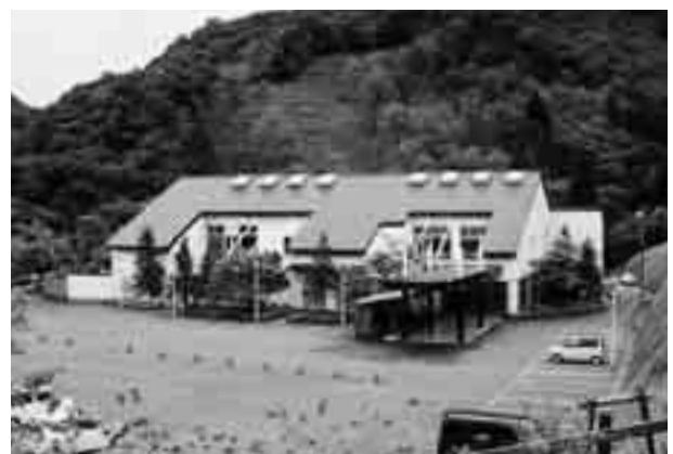
▲新湯治場秋山温泉