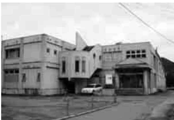
▲上野原スポーツプラザ市民プール