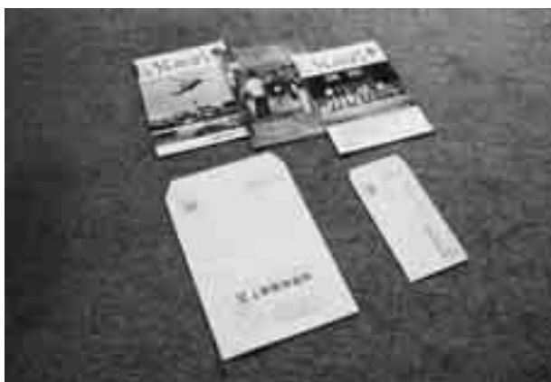
▶ 広告が掲載される広報うえのはらと上野原市封筒