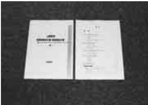
▲障害者基本計画・障害福祉計画(案)