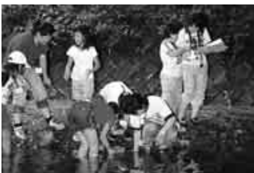
▶ 昨年の活動の様子