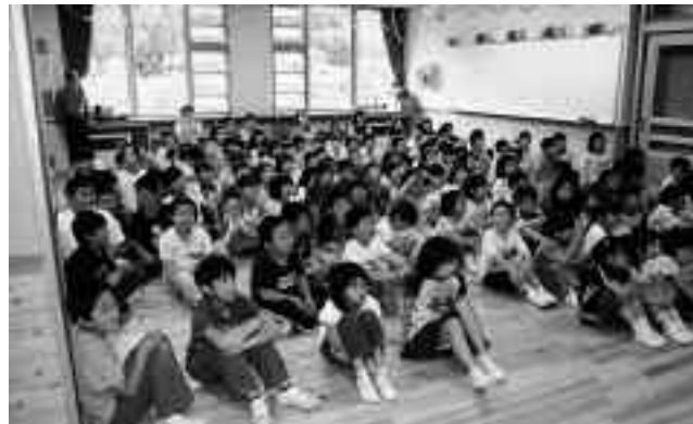
▲秋山小学校全校児童での歓迎会