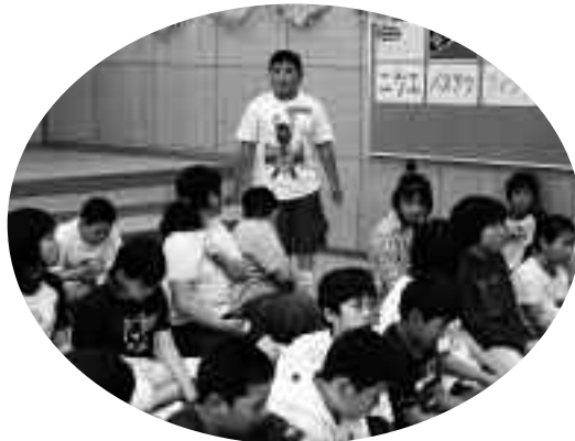
▲出身国のことについて質問

小学生の頃から国際交流があったけれど、中学生になって英語の勉強をしてからの国際交流で、実際に習った英語が外国の人に通じてよかった。