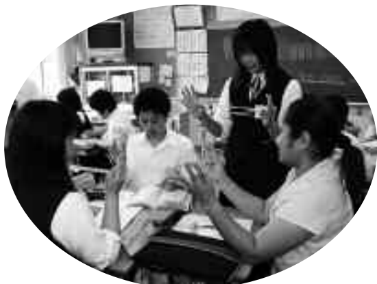
▲あやとりを教える生徒たち