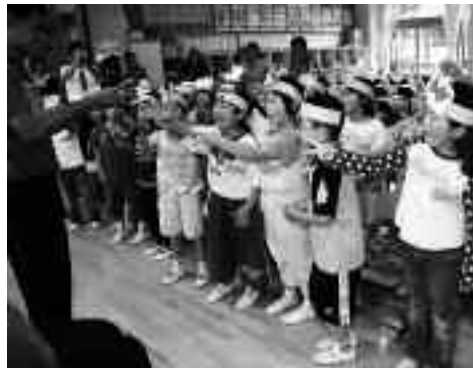
▲じゃんけんゲームを楽しむ児童

外国の方と接することがあまりないので、言葉が通じないかと不安でいっぱいでしたが、知っている単語やみんなで協力して、伝えたいことが伝えられて、良い経験になりました。