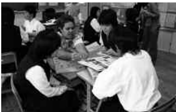
▲英会話でのお互いの国の紹介

秋山小学校と中学校では、他の国々との交流をとおり、異国文化を尊重し、自国の文化を見つめる気持ち を育てることを目的に交流集会を開催しました。中学校では各学年ごとに英語で日本の名所や旧跡を紹介したり、折り紙やけん玉、あやとりなどを実践したりして、日本の文化を紹介していました。また、市職員による「上野原市秋山地区の経済」と題した講演も行われました。 小学校では、全校児童での歓迎会のあと、低学年・中学年・高学年の3グループに分かれて、お互いの国々を紹介したり、ゲームや踊りを楽しんだりして、交流を深めました。