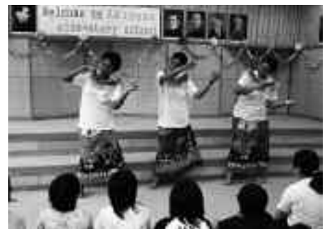
▲自国の踊りを披露