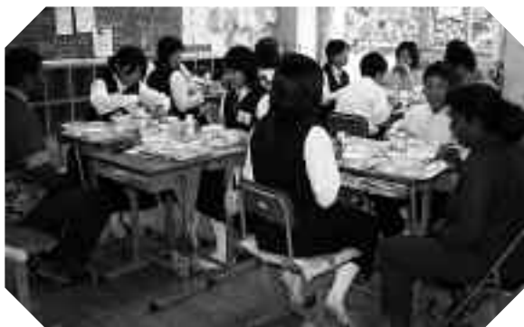
▲給食を食べながらの語らい