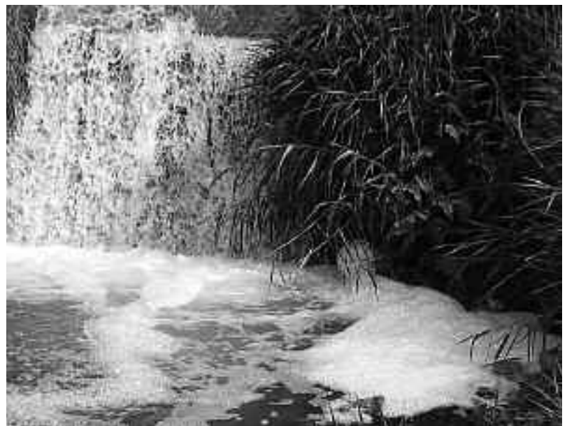
▲生活排水が流れ込み、洗濯等の泡が目立つ鶴川流域(新田倉) 6月7日撮影

ありがとうございます。さて、下水道が供用開始になっている地域にお住まいのみなさんには、公共下水道がいつでも使用可能な状態になっています。