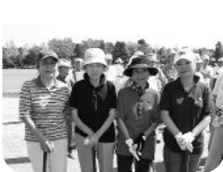
▶ グランドゴルフ参加者