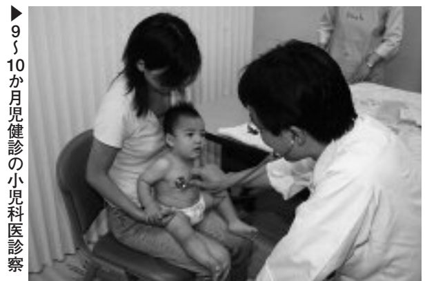
▶9〜10か月児健診の小児科医診察