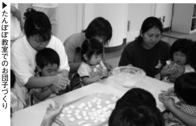
▶たんぽぽ教室でのお団子づくり

間をなかなかとることができないようです。しかし、教室に参加することで、親子で楽しく遊ぶ機会になったり、家での遊びの参考になったりしているようです。また、教室では、おもちゃの片づけや貸し借り、他の子どもたちと一緒に行動したり、あいさつをしたりするということを繰り返します。そうすることによって、少しずつ子どもたちができることが増え、教室に参加して子どもが成長したと思える保護者が多くなるようです。 教室の参加動機としての意見にも多いのですが、子どもの友だちづくりばかりではなく、母親同士の友だちを求めている人も多いようです。