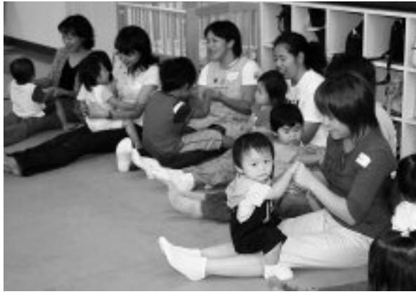
▲母と子の健康教室

この時期は、乳児から幼児になり、生まれたときから比べると、心も体も大変成長していることを感じられるころだと思えます。しかし、子どもの成長が順調であるか、食事、歯のことなど、育児においての気がかりも出てく