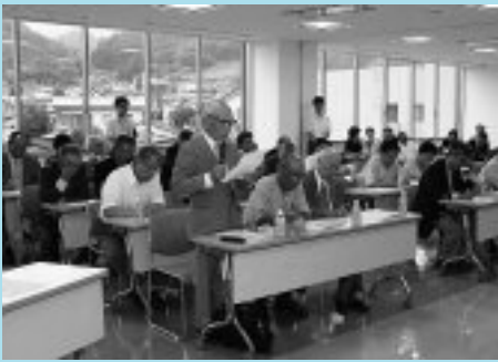
▶ 対話集會での意見交換

対話集會終了後、各地で活動しているみなさんとの交流対話として、2か所を訪れました。初めに、市社会福祉協議会のふれあいいきいきサロンを訪問し、サロン参加者と歌を歌ったり、話をしたりしました。続いて、秋山地区で活躍しているママさんバレーボールチームとバドミントンチームを訪れました。知事は、練習の見学後、体育館履きに履き替え、実際にバドミントンのラリーを行いました。