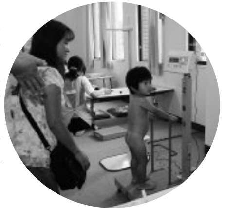
▶どのくらい大きくなったかな

また、相談において、継続した支援が必要だと思われる子どもたちを対象に、毎月1回教室を実施しています。子どもがのびのびと成長・発達できるように、遊びをとおして保護者と保育士や保健師、心理相談員とが一緒に考えていく教室です。そして、子どもの特徴をとらえて子どもの発達に合った