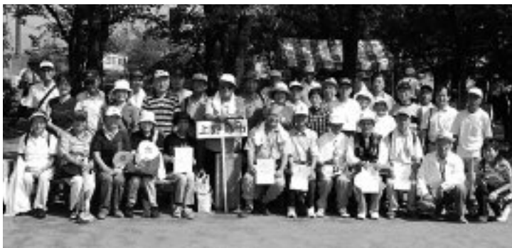
▶ みんなでハイチーズ

9月10日(土)甲府市小瀬スポーツ公園を主会場に、「いきいき山梨ねりんピック2005」高齢者総合スポーツ大会が開催されました。