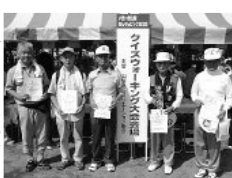
▶ クイズウォーキング優勝

当市からは、市老人クラブ連合会を主体として、40名が参加しました。クイズウォーキング大会では、種目別優勝を飾りました。