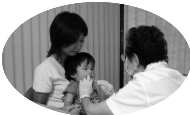
▲1歳6か月児健診の歯科医診察