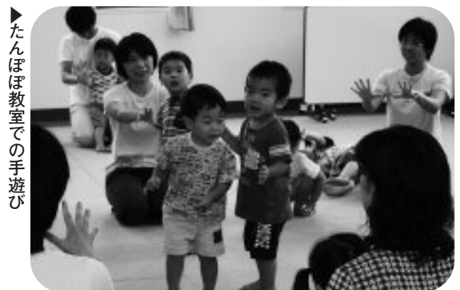
▶たんぽぽ教室での手遊び