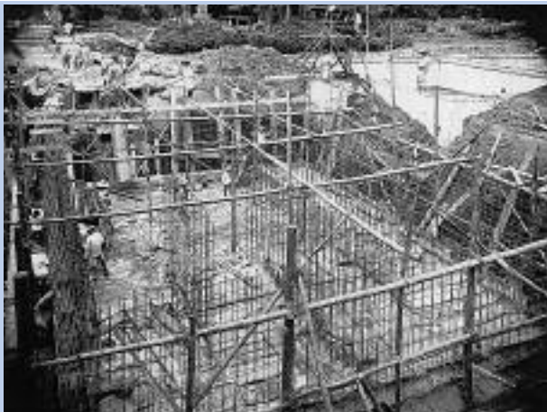
▶昭和12年上野原浄水場第2次拡張工事

営業時間 午前8時30分～午後5時 15分(土・日・祝日・年末年始は休業となります。)