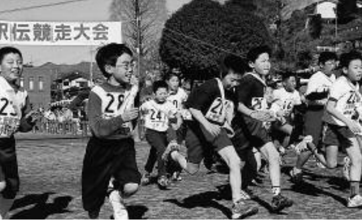
▲1区スタート直後の走者