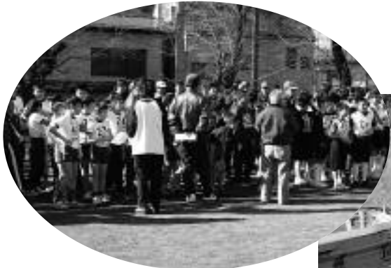
▲スタート前の緊張の時