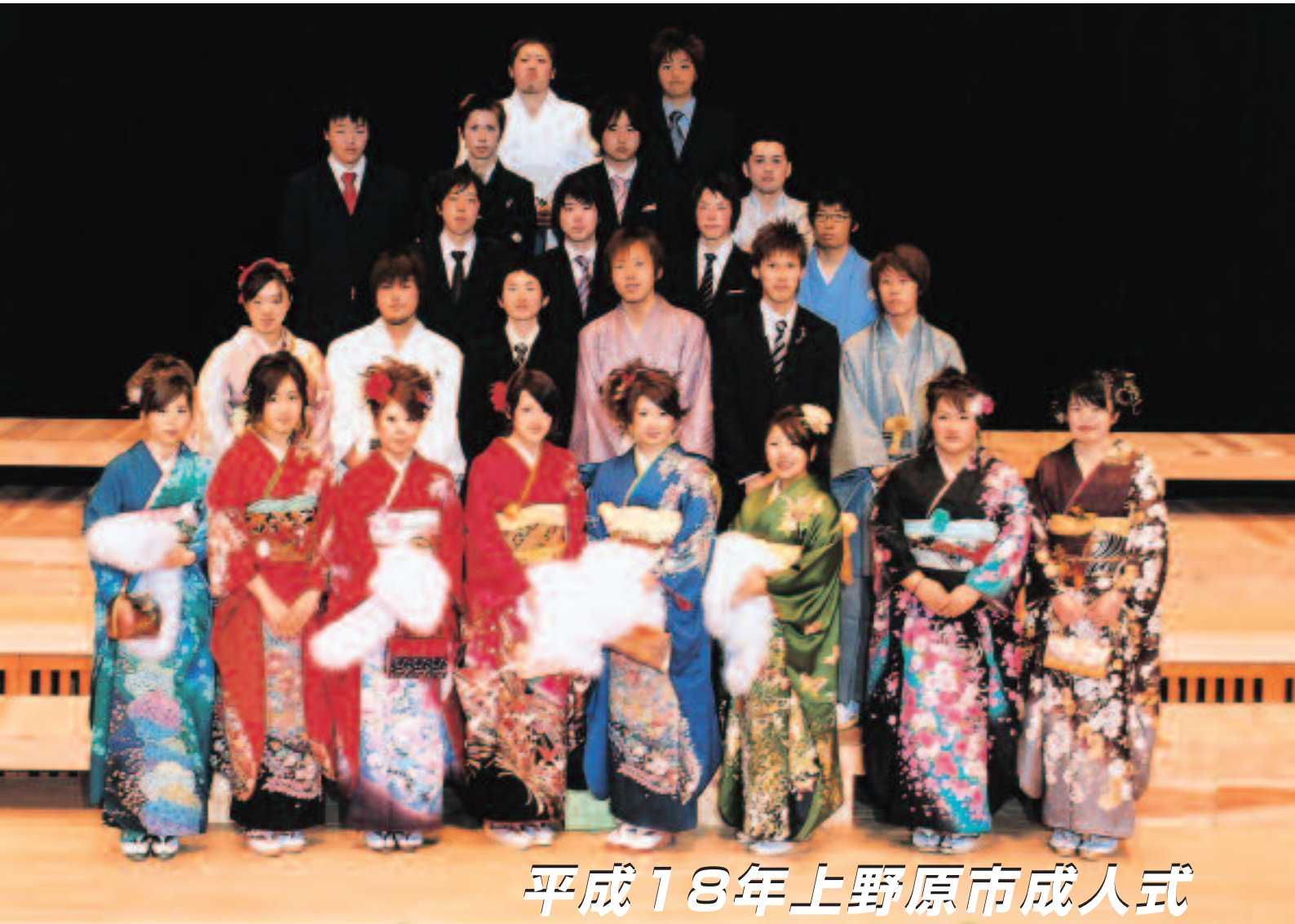
平成18年上野原市成人式