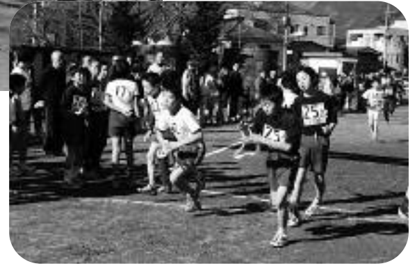
▲第2走者から第3走者へのタスキ渡し