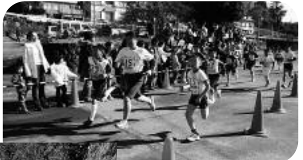
▲声援を受け走る走者