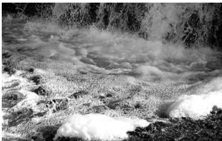
▲生活排水で汚染される河川（巖地区松留にて）12月16日撮影

A みなさんに納めていただく下水道使用料は、主に下水道処理場の運転・管理や、下水道管渠の清掃・修理など下水道施設の維持管理費用として使われています。