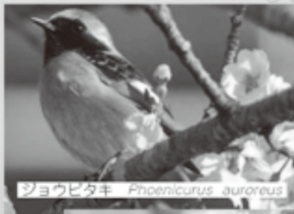
ショウビタキ Phoenicurus aureus

桜並木には、花を目当てにメジロやシジュウカラ、ヒヨドリなどもやってきますので、双眼鏡や望遠に強いカメラを持って行くのもお勧めですよ。