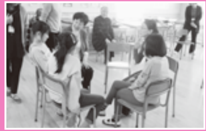
▲放課後子ども教室（手話教室）