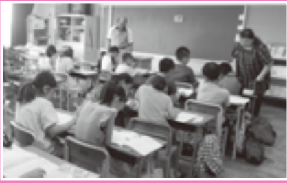
▲学力フォローアップ冬季教室