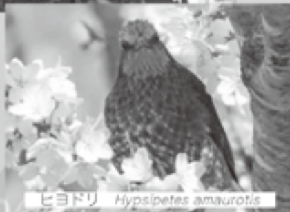
ヒヨドリ Hypsipetes amaurotis