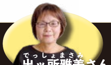
でっしょまさみ 出ツ所雅美さん

特別な資格はいりませんが、後見人活動を行うための知識、技術、姿勢などを身につけるため、今年度から実施する「市民後見人養成講座」を受講する必要があります。