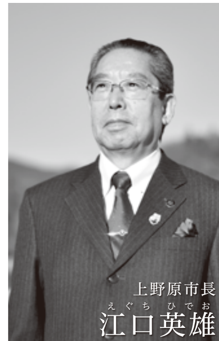
上野原市長 えぐち ひでお 江口 英雄