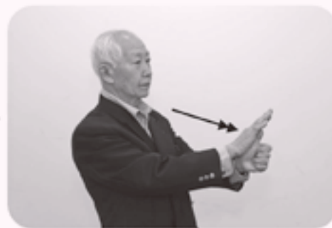
左手の立てた親指の背を右手掌で前に押し出すように2回たたく