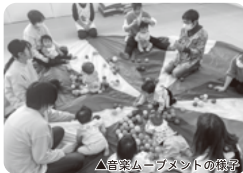
△音楽ムーブメントの様子