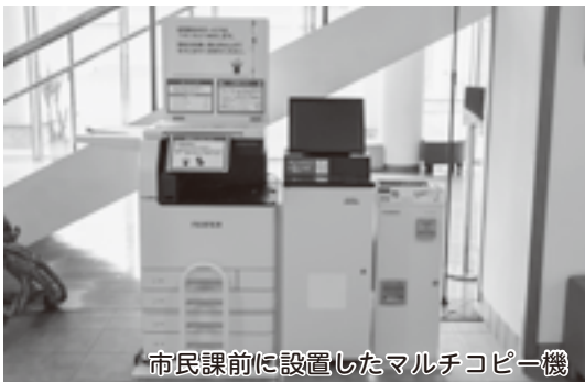
市民課前に設置したマルチコピー機