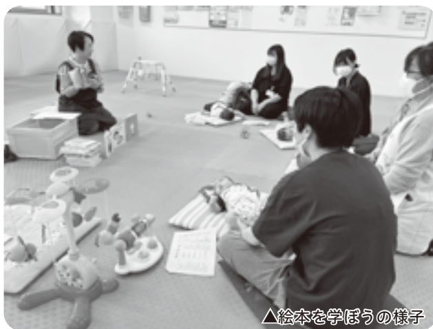
△絵本を学ぼうの様子