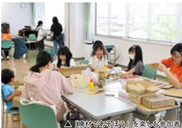
△「廃材であそぼう」を楽しむ参加者

5月31日（日）、市が推進する地域コミュニティ支援事業「上野原市シェアタウン」にて、「やってみよう！つながりひろば」がもみじホールで開催されました。このイベントは、体験や遊びを通して交流し、ゆるやかなつながりをつくることを目的に毎月開催しており、当日は「廃材であそぼう」と「お花のクリアボールづくり」の2つの体験が行われました。参加者たちは夢中になって作品づくりを楽しんでいました。