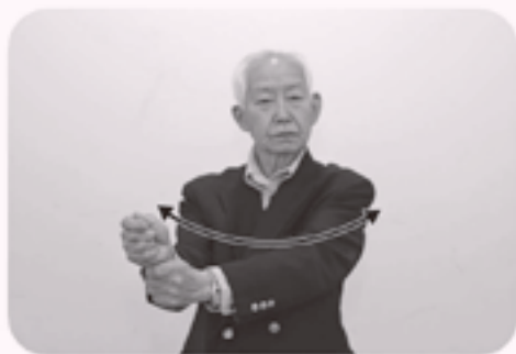
両手拳を上下に置き、ゆるやかな弧を描いて同時に左右に振り、