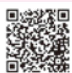
▲環境省公式 LINE 友だち登録 QR コード

防災無線で放送されない「警戒アラート」等の情報は、環境省の公式 LINE アカウント（右記 QR コード）で直接受け取れます。居住地域を設定するだけで情報をいち早く確認できるため、ぜひご登録ください。