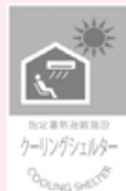
▲クーリングシェルター表示