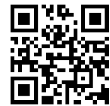
つうえんポータル

右記の二次元コードを読み込み、つうえんポータルにアクセスし、その画面にてお住まいの自治体を選択し、利用申請をしてください。